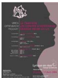
10ème édition [Belle-Ile-en-Mer] Lyrique en Mer 20 juillet-17 août