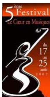
[Ardèche] Le Cœur en Musiques 5 ans déjà!